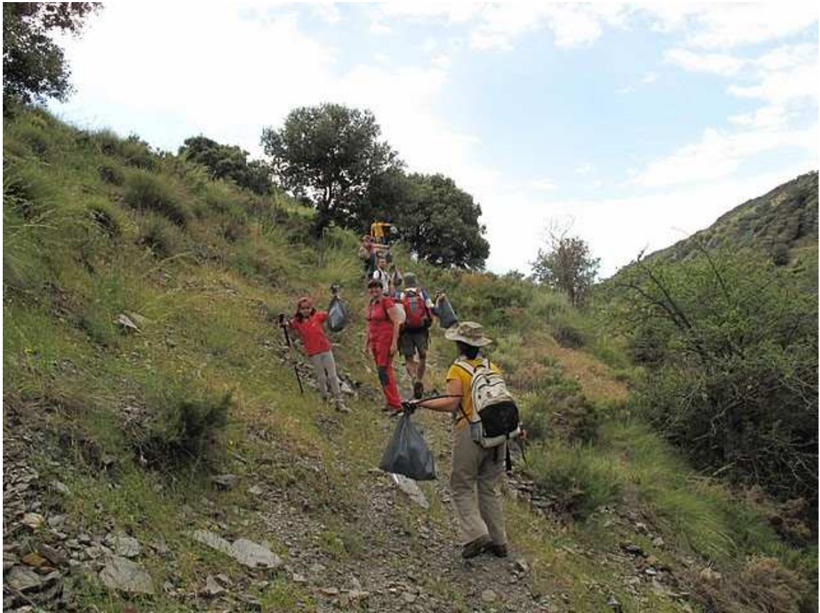
Grupo limpiando vereda Río Bayarcal