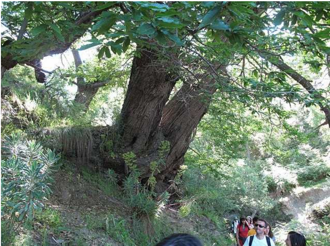
Itinerario por el paraje de Los Molinos