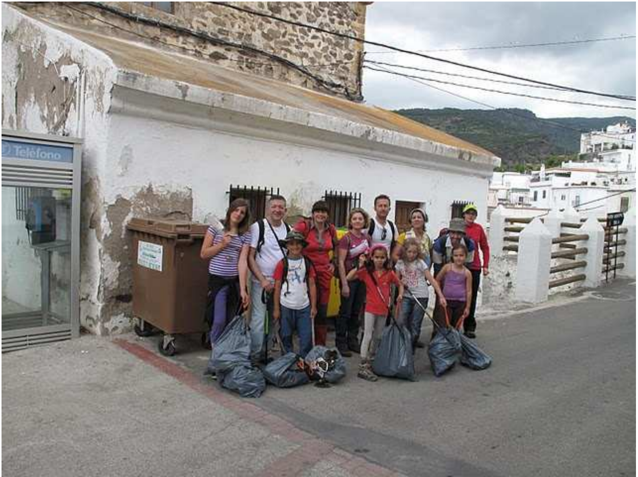
Equipo ganador recogiendo basura