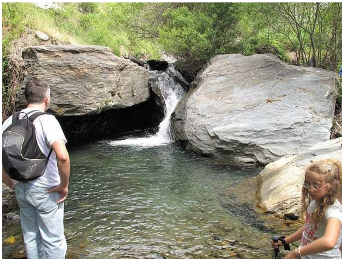
Paraje del Río de Bayarcal