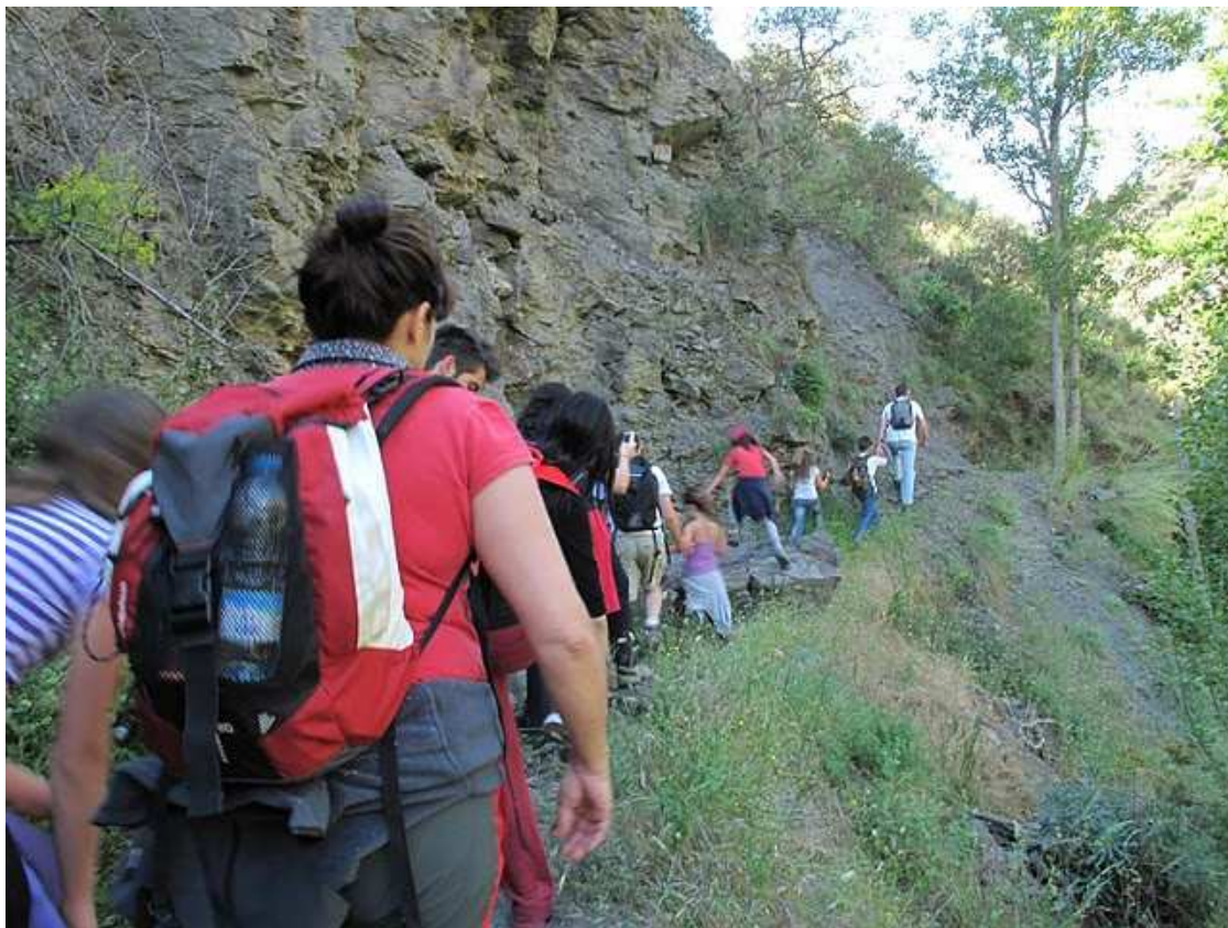
Itinerario por el paraje de Los Molinos