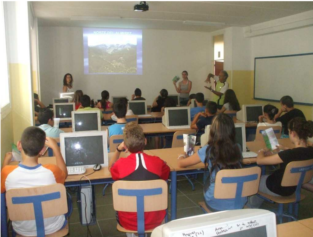
Charla-Proyección en el IES El Alquián