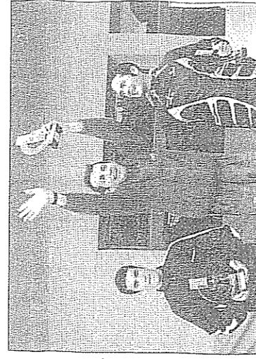
Podio de campeones en la categoría absoluta masculina.