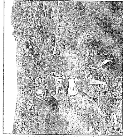
La salida fue en la Ciudad Deportiva de Los Ángeles, mientras que la llegada estaba situada en el Pabellón Municipal del Distrito 6.