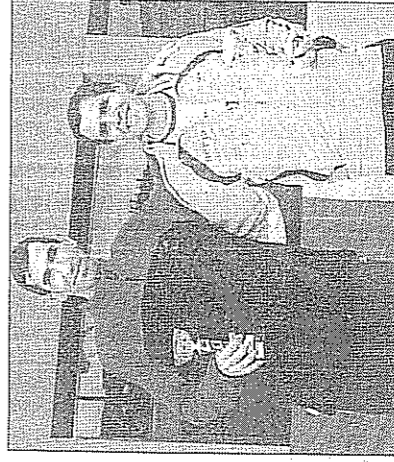
Primeros clasificados en la Categoría Máster Masculina.