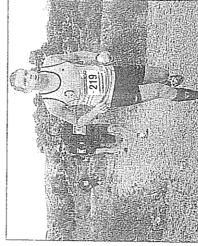
Los corredores acusaron en el último tramo el gran esfuerzo realizado durante la exigente prueba.