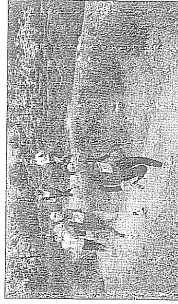
Los atletas tuvieron que superar los numerosos obstáculos que jalonaban el recorrido.