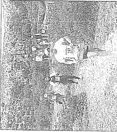
La prueba discurre por bellos parajes de la zona norte de la capital almeriense.