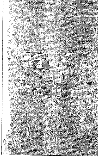
Un total de 240 atletas participaron en la competición.