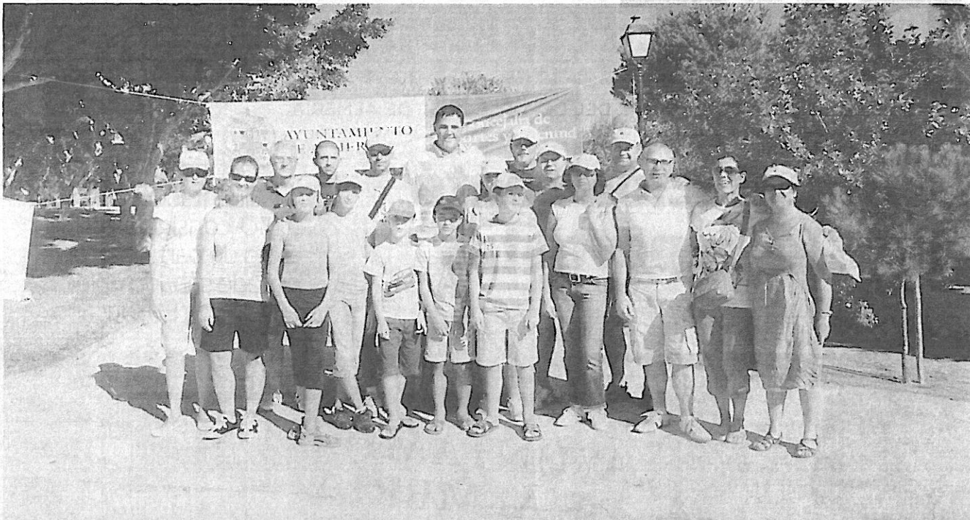
Orientación. El concejal de Deportes, con un grupo de participantes en el trofeo de orientación de Feria, el pasado sábado, en el Parque El Boticario.