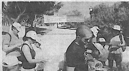
Planos. Los deportistas aprenden a leer mapas. :: IDEAL

Las carreras de orientación recogen un amplio abanico de posibilidades. Se basan en una actividad recreativa que se desarrolla en plena naturaleza, en un divertido juego organizado por y para un grupo de jóvenes o de cualquier edad que añade variedad a su programa de actividades y desarrolla destreza en movimiento por el bosque y es una actividad para mejorar la forma física, entre otros valores. Requiere resistencia e inteligencia y ambas facultades, física y mental, se utilizan continuamente durante la competición. En ella se tiene que realizar un recorrido.